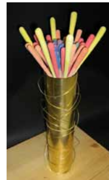
Vatromet MATEA BUČAN kombiniran (keramika, mesing)