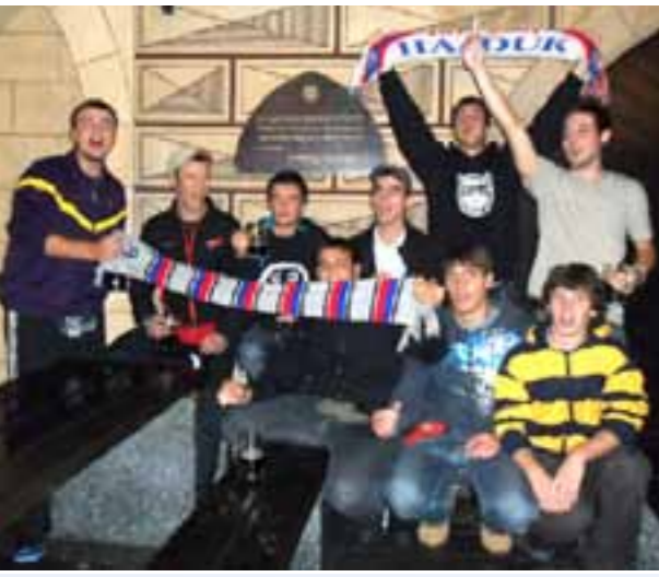
Flek...Hajduk...svaki komentar je suvišan...