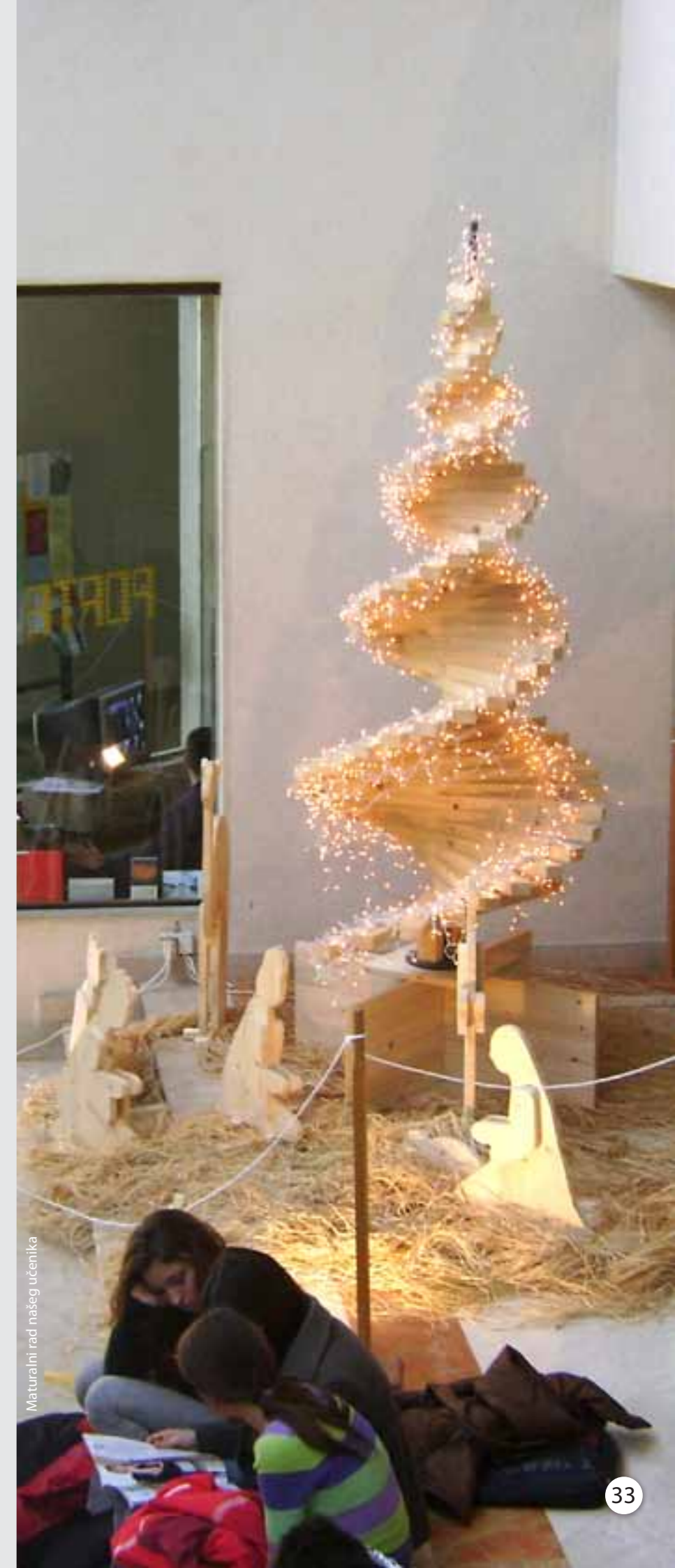
Maturalni rad našeg učenika