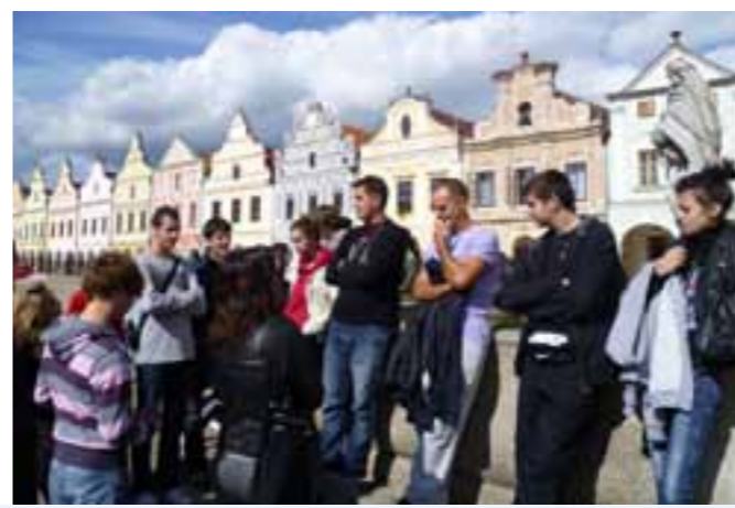
...a kamo sad?...