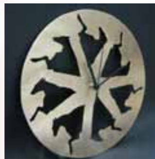
Konji IVAN BULJAN obrađeni brušeni tombak (metal)