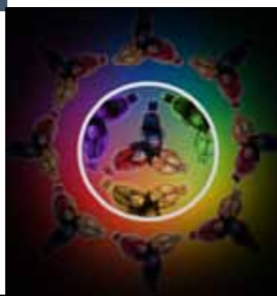
Kaleidoskop MIA ŠANTIĆ fotografija