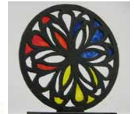
Rozeta KATARINA ERCEG kombinirana (stiradur, gips, staklo)