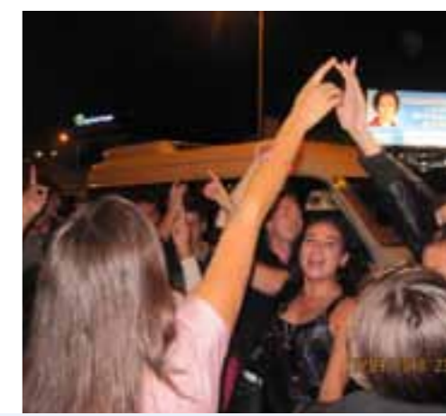
... zabava prije zabave...