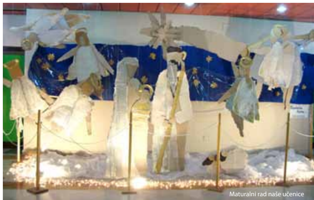
Maturalni rad naše učenice