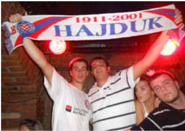
...O Hajduče! ...dica su tvoja uvijek uz tebe...