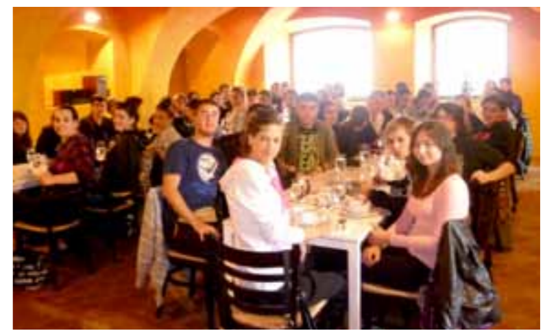
...svi na okupu za kraj...