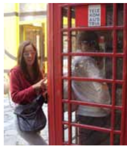
...mama, ja ću ostat vanka do jedanajst...