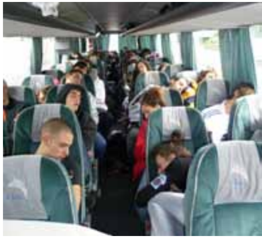
...i svako jutro ispočetka...