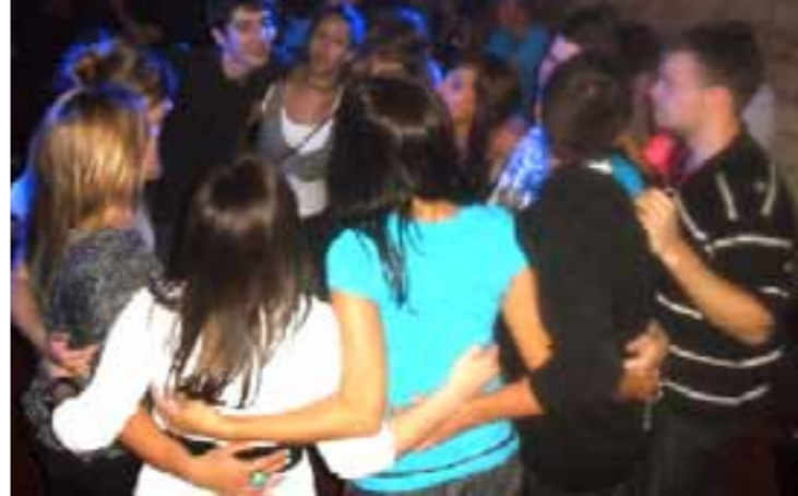
...Posljednji zagrljaji u Prdela...