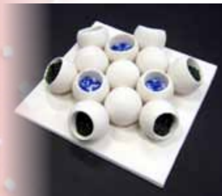
Zatvoreni odsjaj MATEA BUČAN kombinirana (staklo, keramika)

Jedanaesto školsko natjecanje u crtanju provedeno je za učenike, najbolje crtače, trećih i četvrtih razreda zanimanja aranžersko-scenografski dizajner, dizajner unutrašnje arhitekture, dizajner keramike i dizajner metala koji se obrazuju u umjetničkim zanimanjima u Graditeljskoj obrtničkoj i grafičkoj školi u Splitu.