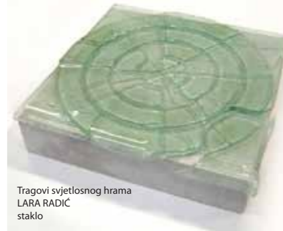
Tragovi svjetlosnog hrama LARA RADIĆ staklo