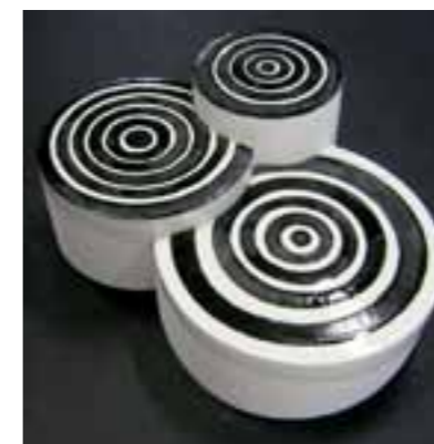
Vertigo IVANA VRGOČ keramika