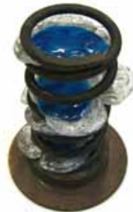
Aurora borealis (Južna zora) ANA KADIJEVIĆ kombinirana (metal, staklo)

Odabir uradaka prezentiran je dana 26. 1. 2010. u školskoj crtaonici u prisutnosti svih mentora i ocjenjivačkog povjerenstva.