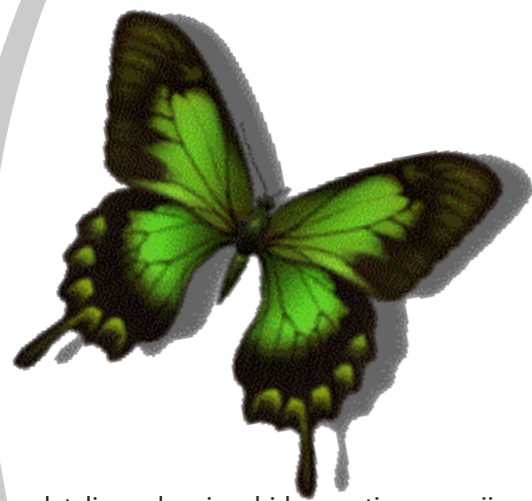
detalj s naslovnice zbirke narativne poezije

Rekoše mi da si mrtav, da ne otvaraš oči već dugo Nikad nisi opraštao, uvijek si odmah sve zaboravljao. Jesi li zaboravio i na nas? Ti ljubiš neizmjereno, naša srca su besramna I radostan si, mi samo znamo patiti. Tražiš istinu, a mi smo je davno zakopali. Uvijek se smiješ, mi ljudi strahujemo. Poznaješ ljepotu, mi je nikad nismo ni sreli. Posjeduješ tako divne riječi, naši jezici su zli. Odavno si već slobodan, mi smo postali nesvjesni robovi svega. Živimo u kaosu neviđenog rata – reci mi – kako izgleda mir? Poklonili smo se novcu i ovom modernom vremenu, a ti ni kruha ne tražiš? Rekoše mi da si mrtav, da ne otvaraš oči već dugo A ni ne slutimo koliki smo slijepci i da vidiš bolje od nas! Ne budite sanjara izgubit će se u javi.