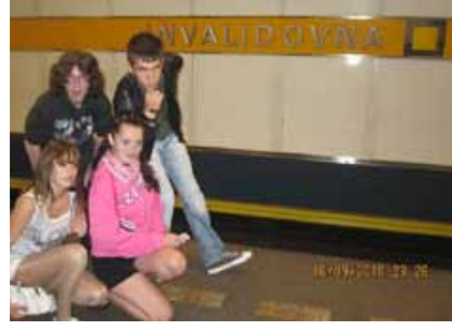
...svjetski putnici u noćnom životu Praga...