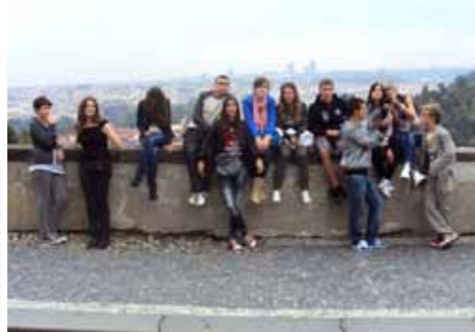
...malo odmora na zidiću...