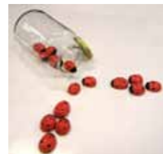
Bubamare ANTONIJA DRNAS kombinirana (keramika, staklo)

Učenici su se izražavali tehnikom u ugljenu, na temu – poticaj (koju je zadao organizator Državnog natjecanja) CRTANJE PORTRETA PO PROMOTRANJU – živi model.