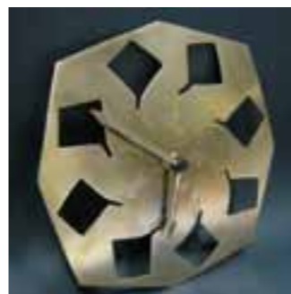
Profil VANA MRŠIĆ obrađeni polirani tombak (metal)